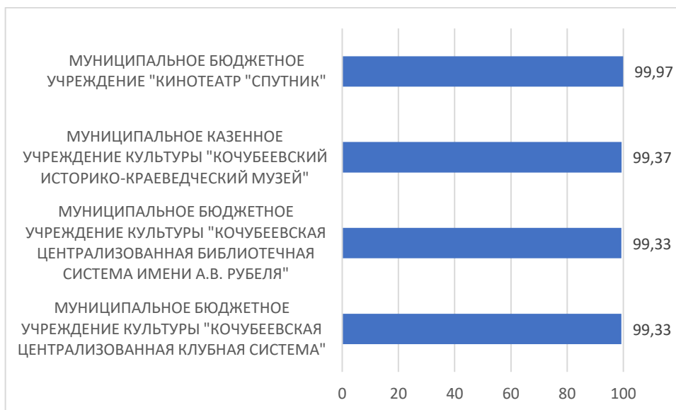
Рисунок 5 – Рейтинг организаций по критерию «Удовлетворенность условиями оказания услуг»

Рейтинг по пятому критерию «Удовлетворенность условиями оказания услуг» независимой оценки качества условий деятельности организаций Кочубеевского муниципального округа. Ставропольского края представлен на Рисунке 5.