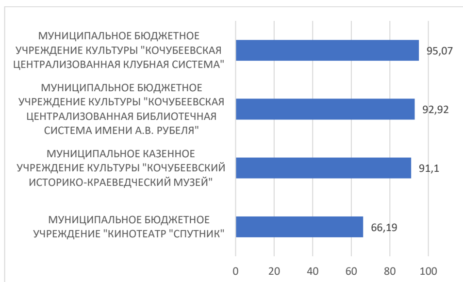
Рисунок 1 – Рейтинг организаций по критерию «Открытость и доступность информации об организации культуры»

Рейтинг по первому критерию «Открытость и доступность информации об организации культуры» независимой оценки качества условий деятельности организаций Кочубеевского муниципального округа. Ставропольского края представлен на Рисунке 1.